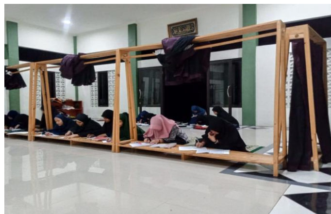
Gambar 3 Kegiatan Pengajian Santri Putri