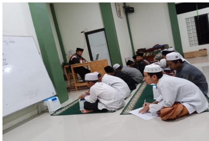
Gambar 2 Kegiatan Pengajian Santri Putra