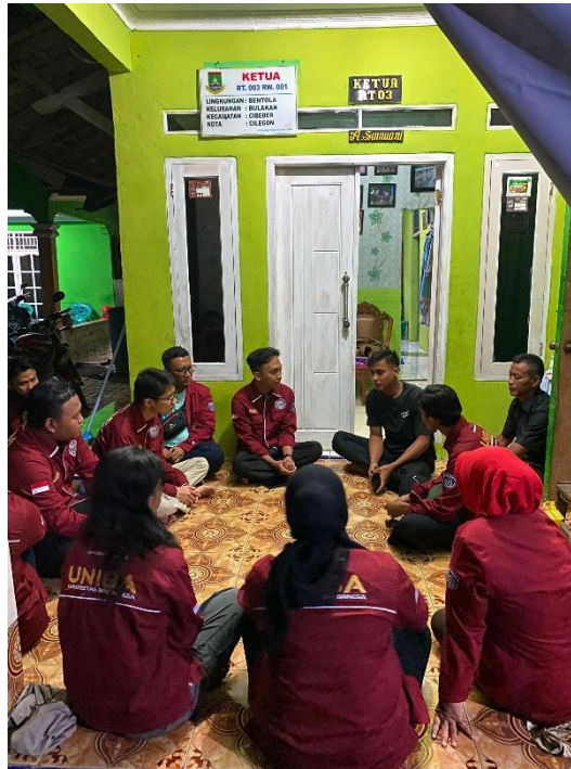
Gambar 3. Pendampingan Manajemen Arsip RT 03/01 Link Bentola Kelurahan Bulakan

Setelah berdiskusi dengan ketua RT 03/01 Link bentola Desa Bulakan dilanjutkan dengan pembuatan prototipe Google Drive dengan link sebagai berikut ini https://docs.google.com/document/d/1TCup08h4ZXstCtSudnQLXg1MILAE6_Mq/edit