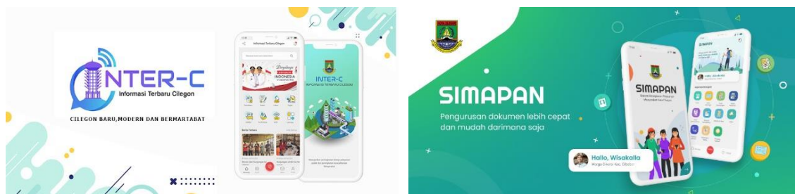
Gambar 1. Aplikasi Inter-C SIMAPAN yang dikembangkan oleh Pemerintahan Kota Cilegon

pengelolaan komunikasi organisasi dan pelayanan dokumen. Aplikasi SIMAPAN yang dikeluarkan oleh pemerintahan Kota Cilegon merupakan aplikasi yang mempermudah warganya berkaitan dengan administrasi pemerintahan. Pengembangan administrasi pemerintahan berbasis aplikasi android oleh Dinas komunikasi dan Informasi serta Dinas Kependudukan Catatan Sipil (Dukcapil).