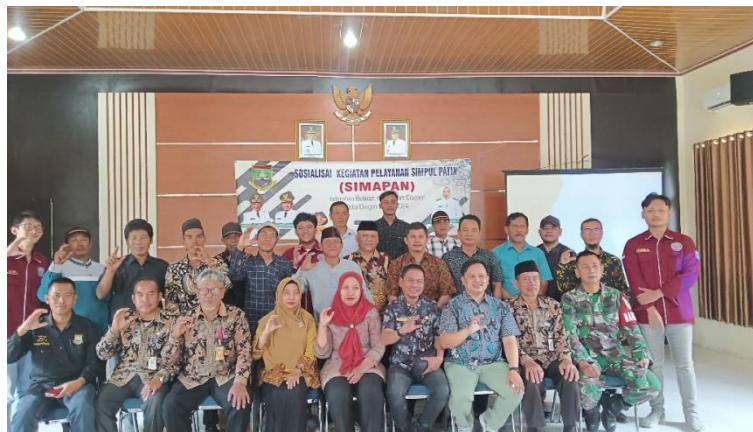
Gambar 2. Sosialisasi Kegiatan Pelayanan Simpul Patin (SIMAPAN)

Kegiatan Sosialisasi Simpul Patin (SIMAPAN) yang dilakukan oleh pemerintahan Kota Cilegon pada pertengahan Bulan Juli 2024 bertempat di Aula Kelurahan Desa Bulakan Kecamatan Cibeber Kota Cilegon Provinsi Banten