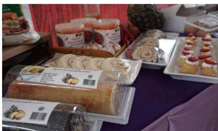
Gambar 1: Pengerajin Desa Cisaat