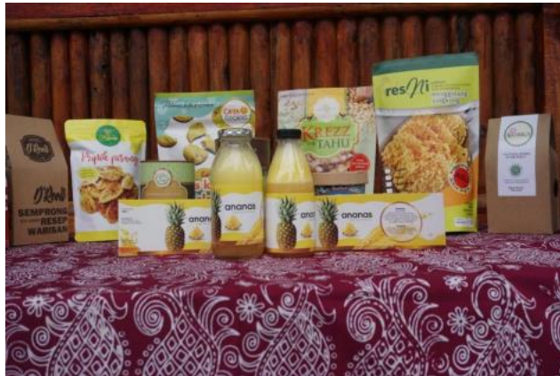
Gambar 3: Pengerajin Nanas Desa Cisaat

Nanas merupakan produk kebanggaan dari hasil panen nanas di desa Cisaat yang dapat menghasilkan beberapa variasi makanan dan minuman. Penjualan makanan dan minuman instan tersebut dapat di ekspor dan sebarakan ke seluruh Indonesia dan berbagai negara yang dapat meningkatkan potensi pengenalan inovasi produk instan dari buah lokal.