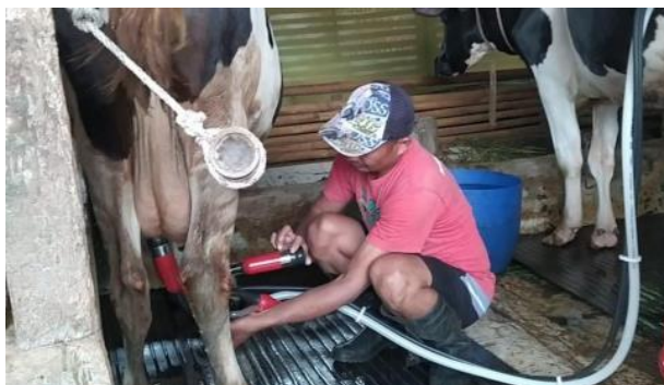
Gambar 2: Pemerah Susu Desa Cisaat