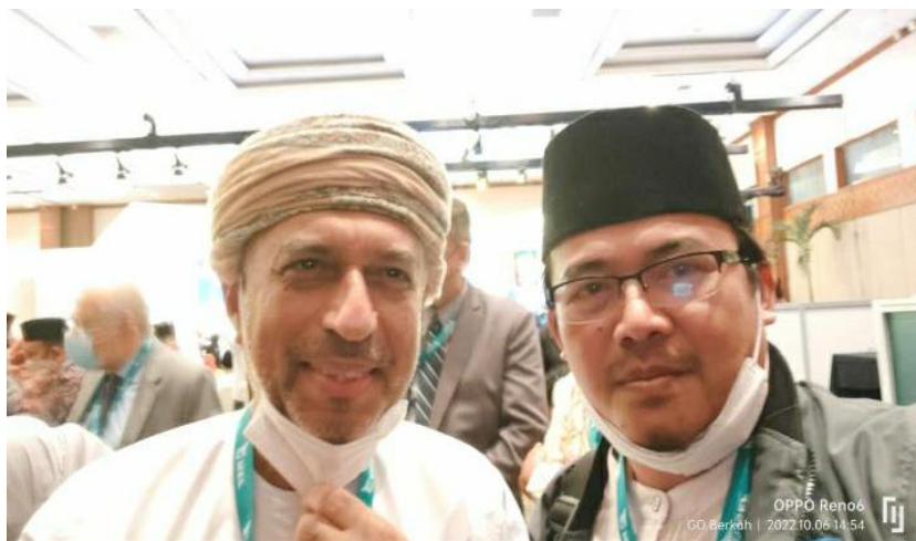
Gambar 3 Suasana Bersama Tutor Dari Arab saudi