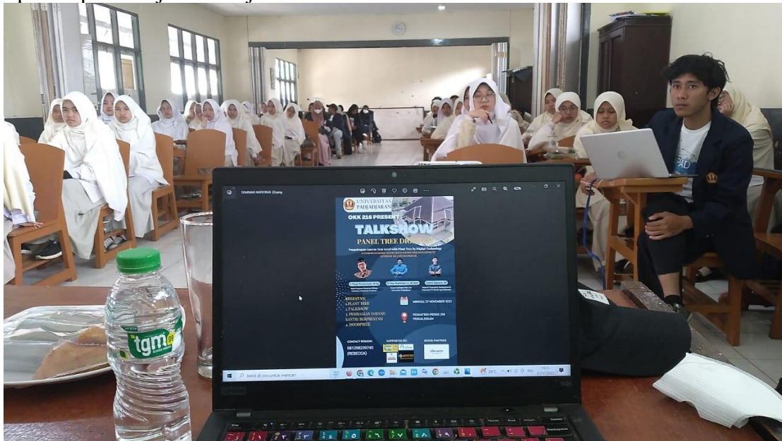
Gambar 2 ;Suasana Bersama Santri Pondok Pesantren PPI 259 Firdaus Pangalengan

Tahapan ini merupakan mimpi atau keinginan atau tujuan yang diharapkan komunitas dampingan dalam mengembangkan aset (potensi) komunitas. Setelah menemukan aset yang dimiliki komunitas dan fokus aset yang akan dikembangkan, maka langkah selanjutnya adalah merumuskan keinginan atau tujuan untuk mengembangkan aset komunitas yang diinginkan atau diimpikan oleh Komunitas Santri Bahasa Arab di Pondok Pesantren PPI 259 Firdaus Pangalengan. Adapun hasil rumusan tujuan atau impian yang diinginkan adalah mengembangkan media pembelajaran berbicara Bahasa Arab pada peserta didik kebahasaan pada aspek pemanfaatan lingkungan berbahasa Inggris sebagai sumber belajar yang sangat efektif dan mengembangkan beberapa metode pembelajaran Bahasa Inggris bagi para tutor guna proses pembelajaran menjadi mudah.