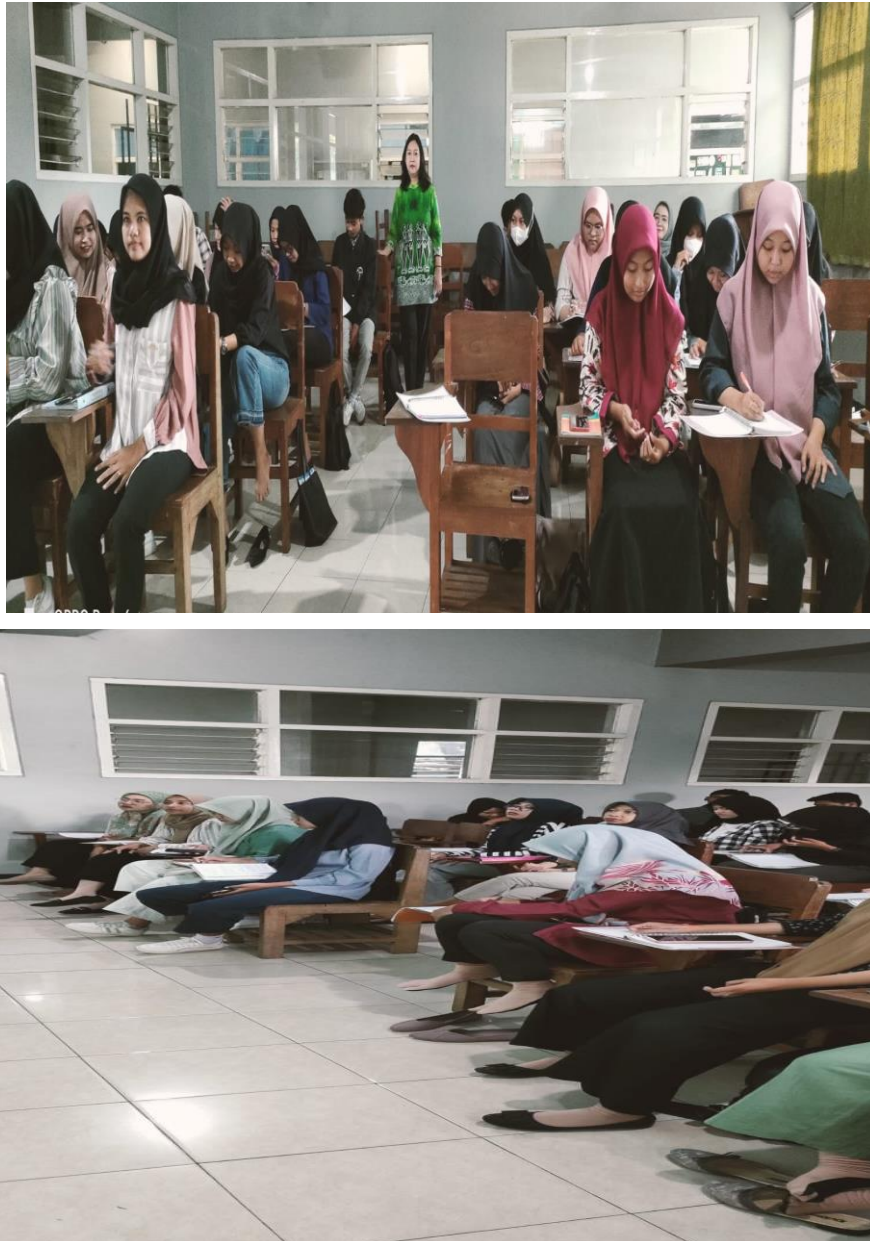
Gambar 1. Tahap pelaksanaan