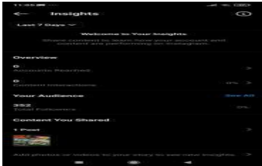
Gambar 2. Contoh Instagram insights