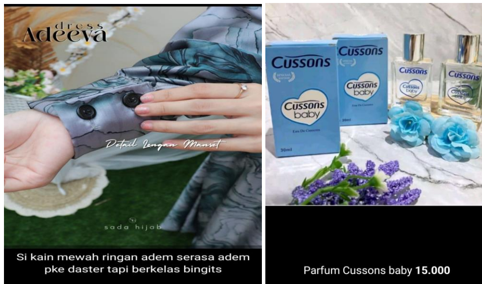
Gambar 3. Contoh Whatsapp marketing peserta

Tahap evaluasi yang dilakukan pada kegiatan pelatihan pembuatan konten digital marketing berupa orientasi hasil peserta pelatihan dengan mempresentasikan hasil karyanya dalam membangun konten baik berupa foto maupun video. Pada saat presentasi setiap kelompok mendapatkan masukan terkait konten yang telah dibuat, sehingga para peserta dapat mengerti tentang tata cara pembuatan konten digital marketing yang menarik dan mudah dipahami oleh konsumen. Dari hasil evaluasi peserta pelatihan, 80% mahasiswa sudah mengerti dan memahami materi pelatihan digital marketing serta dapat mengimplementasikan digital marketing secara efektif dan efisien