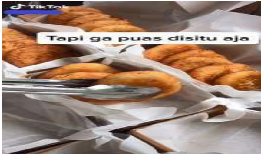
Gambar 4. Contoh Tik tok marketing peserta