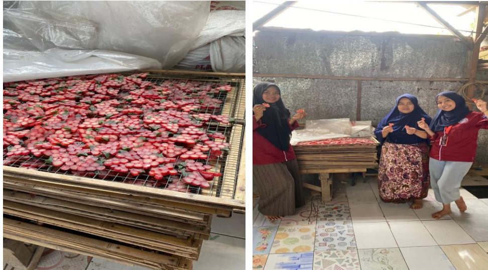
Gambar 1. Observasi Awal ke Pelaku UMKM Kerupuk