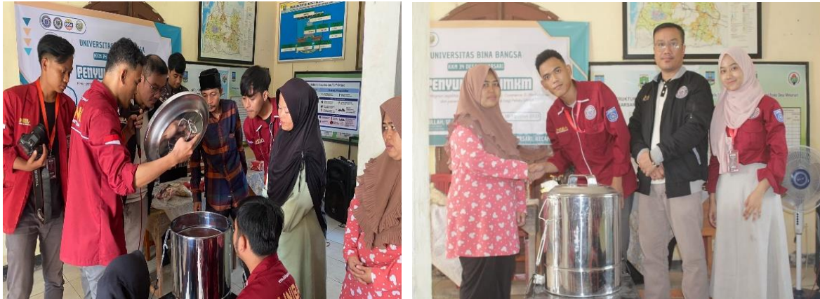
Gambar 5. Uji Coba dan Penyerahan Mesin Pengering Minyak