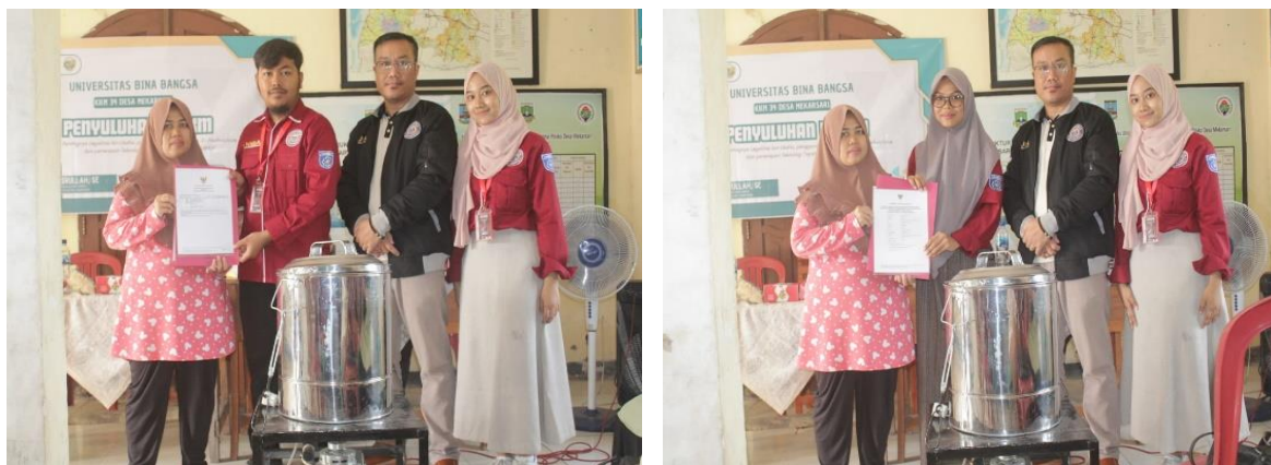
Gambar 4. Penyerahan NIB dan SPP-IRT kepada Pelaku UMKM

Sebagai bentuk legalitas usaha, tim pengabdian mendampingi proses pengajuan Nomor Induk Berusaha (NIB) dan Sertifikat Produksi Pangan-Industri Rumah Tangga (SPP-IRT) untuk pelaku UMKM Kerupuk, sehingga pelaku UMKM Kerupuk memiliki legalitas usahanya.