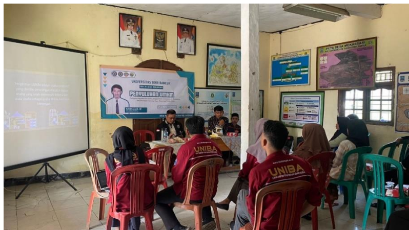
Gambar 3. Penyuluhan UMKM