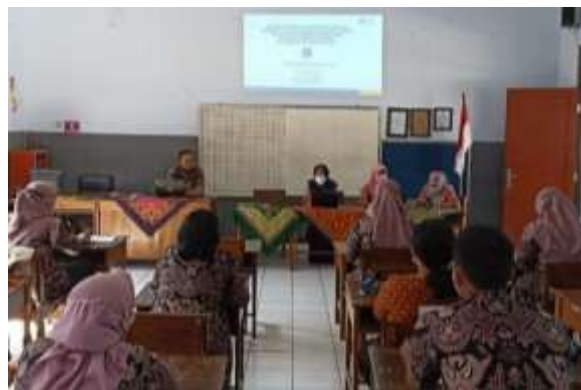
Gambar 1. Penyampaian Materi oleh Narasumber

Kegiatan PKM yang telah dilaksanakan menggunakan pendekatan pelatihan dan pendampingan, dengan tiga tahapan pelaksanaan guna meningkatkan kapasitas kepala sekolah dan guru dalam membudayakan nilai pancasila sebagai basis nilai penguatan pendidikan karakter di sekolah melalui pembinaan peserta didik serta penataan sarana prasarana. Tiga tahapan tersebut yakni tahap persiapan, pelatihan serta evaluasi. Pada tahap persiapan dilaksanakan pertemuan untuk penyamaan persepsi dengan Sekolah Dasar Laboratorium UM Kota Blitar sebagai mitra pengabdian, yang melibatkan tim dosen pelaksana pengabdian kepada masyarakat, pihak sekolah diwakili oleh kepala sekolah, dibantu oleh dua mahasiswa dan dua alumni. Koordinasi tersebut berkaitan dengan teknis pelaksanaan kegiatan, yang selanjutnya disusun panduan serta agenda kegiatan dan materi pelatihan.