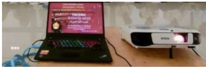
Gambar 3 Peralatan dalam Pelaksanaan Kegiatan PkM secara Daring

Dengan melibatkan mahasiswa secara aktif dalam proses pendampingan, monitoring, dan evaluasi, diharapkan kegiatan PKM ini dapat memberikan kontribusi positif yang signifikan pada pemahaman dan kemampuan mahasiswa dalam menggunakan transliterasi Arab-Indonesia dalam konteks penulisan karya tulis ilmiah.