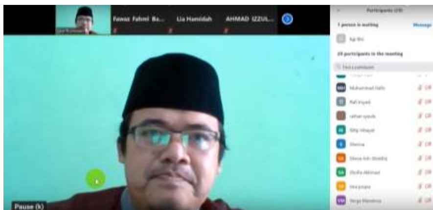
Gambar 1 Pamateri/Narasumber Pemahaman Transliterasi Mahasiswa

Melalui keterkaitan antara kegiatan PkM dan proses pembelajaran, upaya ini diarahkan untuk menghasilkan peningkatan yang signifikan dalam hasil belajar mahasiswa. Indikator keberhasilan dari kegiatan ini mencakup peningkatan pemahaman mahasiswa terkait transliterasi Arab Indonesia, peningkatan motivasi untuk meningkatkan pengetahuan kebahasaan, terutama transliterasi Arab Indonesia, dan peningkatan kemampuan praktis mahasiswa dalam mengaplikasikan transliterasi tersebut dalam konteks kehidupan sehari-hari. Dengan mencapai indikator keberhasilan tersebut, diharapkan kegiatan PkM dapat memberikan kontribusi positif pada pemahaman transliterasi, motivasi belajar, dan kemampuan praktis mahasiswa dalam menggunakan transliterasi Arab Indonesia.