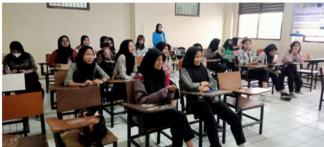
Gambar 3 Peserta Pendidikan Karakter