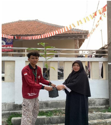
Gambar 2. Penyerahan Bibit ke Masyarakat

Kegiatan ini dilatar belakangi oleh adanya kurang penghijauan di sepanjang Jalan Raya Kecamatan Mekar Baru yang sayangnya masih dapat dimanfaatkan namun terbengkalai. Untuk memfungsikan kembali lahan yang sudah ada, maka dilakukan koordinasi dengan pemerintahan desa Cijeruk dan warga setempat untuk bersama-sama melakukan penanaman kembali pada lahan yang telah kosong