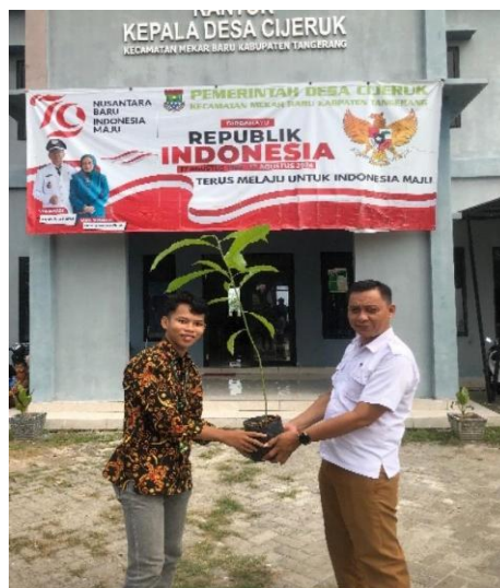
Gambar 1. Penyerahan Bibit Pohon di Kantor Desa

Program ini diharapkan dapat meningkatkan kesadaran masyarakat dalam memanfaatkan lahan pekarangan rumah untuk kegiatan produktif sehingga bernilai lebih kemudian menumbuhkan rasa sadar akan pentingnya menanam pohon karena memiliki peran penting dalam menjaga keseimbangan lingkungan. Selain itu penanaman merupakan salah satu bentuk peran manusia dalam menjaga lingkungan dan memberikan kesan segar dan memperindah pemandangan di tempat-tempat umum, penghijauan ini juga memberikan banyak manfaat bagi lingkungan. Pohon-pohon yang ditanam akan mengatasi polusi yang banyak dihasilkan di jalan raya, dan memberikan suplai oksigen bagi manusia.