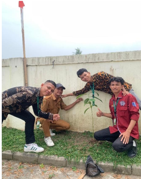
Gambar 4. Penanaman Bibit Pohon di sekitar Kantor Desa

Lahan-lahan kosong yang di pinggir jalan ditanaman dengan pohon Cempaka dan pohon Kelapa. Penanaman bibit pohon bersama kepala Desa Cijeruk dan warga desa Cijruk Kecamatan Mekar Baru yang dilakukan pada sore hari yang dilaksanakan di sepanjang jalan raya desa Cijeruk. Desa ini juga memiliki suasana yang sejuk karena masyarakat desa Cijeruk sendiri sebagian besar memanfaatkan pertanian sawah untuk mencari nafkah.