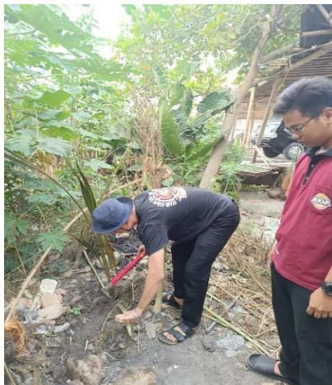
Gambar 5. Penanaman bibit bersama warga

Lahan-lahan kosong yang di pinggir jalan ditanaman dengan pohon Cempaka dan pohon Kelapa. Penanaman bibit pohon bersama kepala Desa Cijeruk dan warga desa Cijruk Kecamatan Mekar Baru yang dilakukan pada sore hari yang dilaksanakan di sepanjang jalan raya desa Cijeruk. Desa ini juga memiliki suasana yang sejuk karena masyarakat desa Cijeruk sendiri sebagian besar memanfaatkan pertanian sawah untuk mencari nafkah.