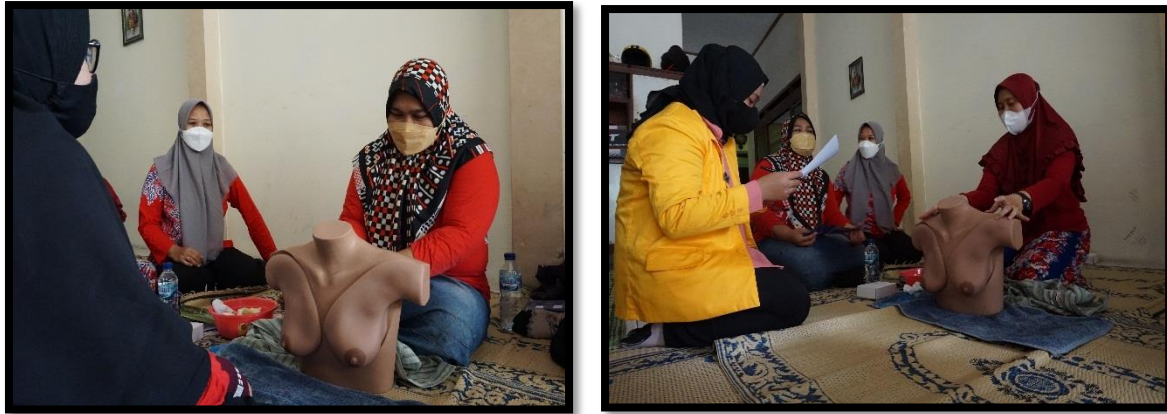
Gambar 7: Evaluasi Skill Metode BOM Massage