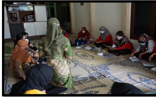
Gambar 4: Materi Ceramah Dosen