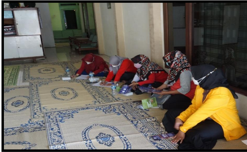
Gambar 2: Pre Test

Pre test dilaksanakan pada setiap kader yang datang, untuk mengetahui seberapa besar pengetahuan mereka tentang metode BOM Massage. Pre Test menggunakan test yang berisi 8 soal tentang metode BOM Massage. Setelah selesai, dikumpulkan dan dinilai pengetahuan kader tentang metode BOM Massage. Dari hasil yang didapatkan, nilai maksimal 5 dan nilai minimal 25. Rata-rata pengetahuan kader tentang metode BOM Massage sebesar 28,86%.