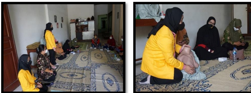
Gambar 3: Materi Ceramah Mahasiswa

Tahapan kedua dari pengabdian ini adalah pemberian materi yang diberikan oleh Dosen dan mahasiswa kepada para kader tentang materi metode BOM Massage seperti, pengertian, manfaat, dan cara kerja. Pelaksanaan kegiatan dibantu dengan penggunaan media pembelajaran leaflet/brosur dan juga Booklet.