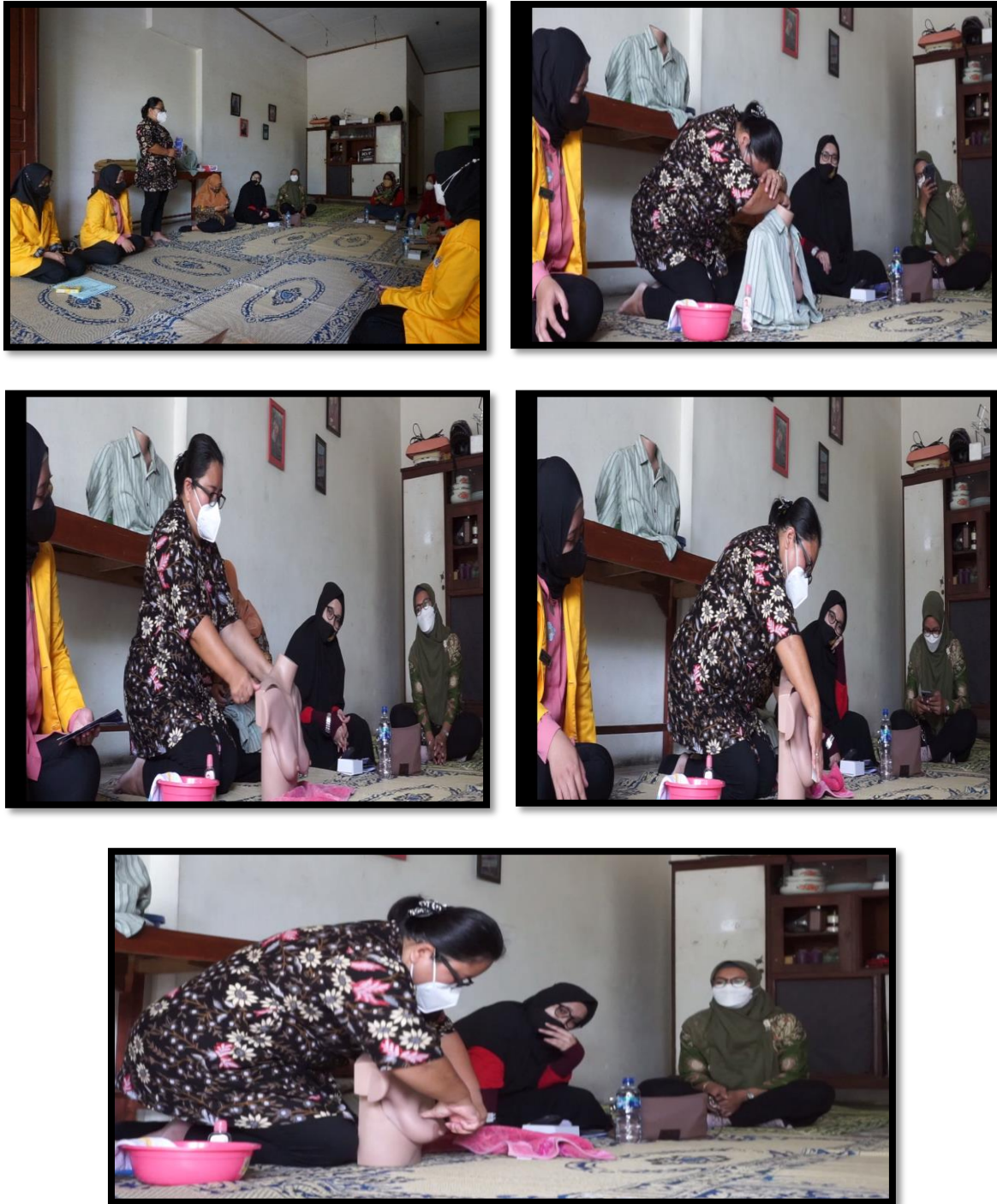
Gambar 5: Simulasi Metode BOM Massage