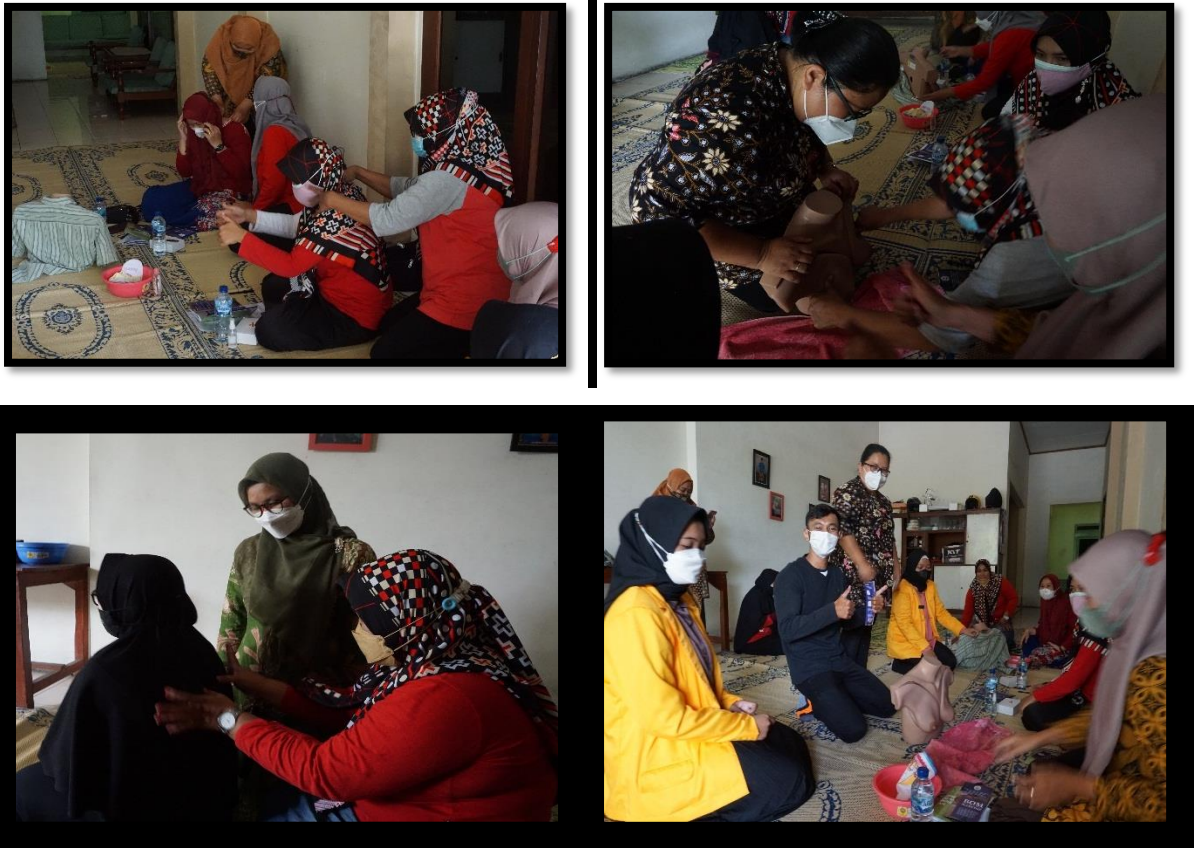
Gambar 6: Role Play Metode BOM Massage