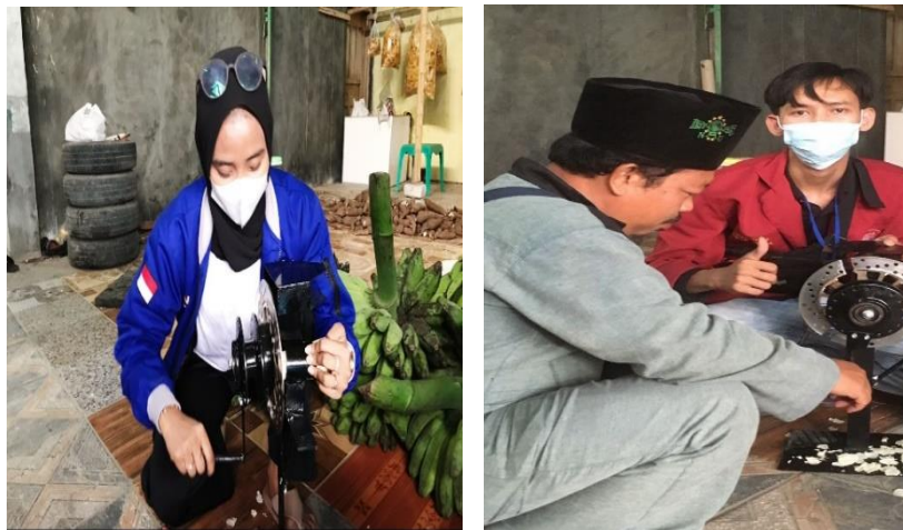
Gambar 6 Uji Coba dan Penyerahan Alat Pengiris Pisang Kepada Pelaku UMKM Keripik Pisang

Hasil analisis dari kegiatan yang sudah dilakukan, diperoleh bahwa: