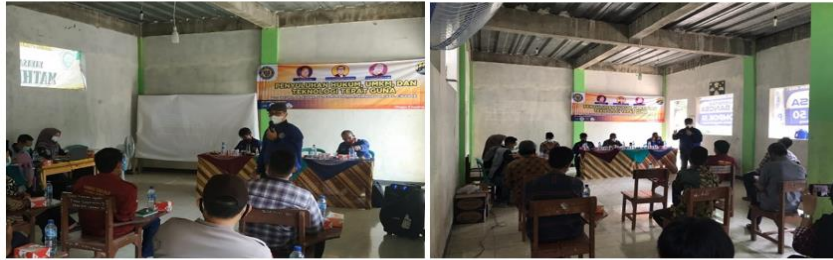
Gambar 3. Penyuluhan Masyarakat