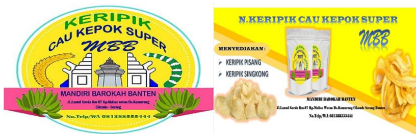
Gambar 3. Logo Resmi dan Banner UMKM Keripik Pisang MBB