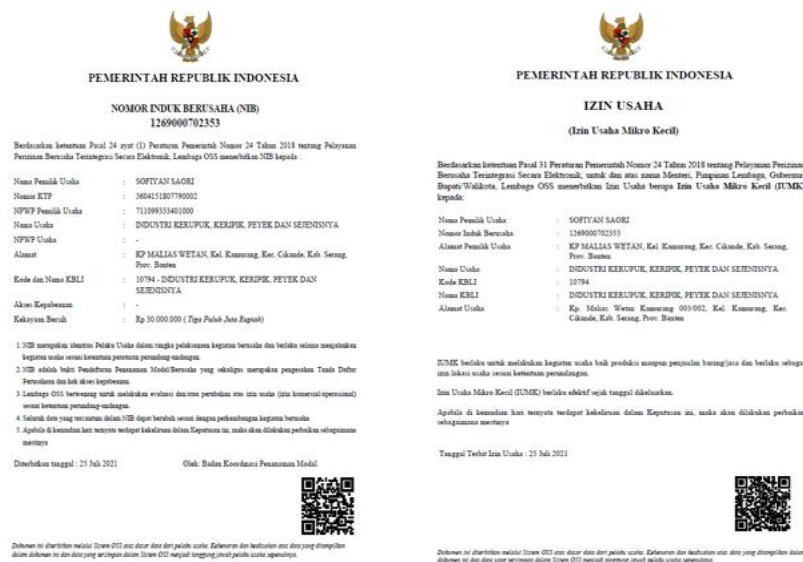
Gambar 5. Nomor Induk Berusaha (NIB) dan Izin Usaha Mikro Kecil (IUMK)