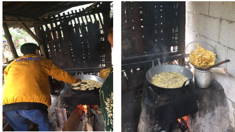
Gambar 3 Proses Pengolahan Kripik Pisang