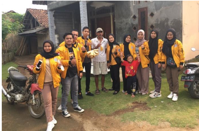
Gambar 2 Survei Lokasi UMKM Kripik Pisang

Pertama melakukan tinjauan lokasi yang memang bertujuan untuk melakukan penelitian demi mengetahui kelemahan dan kelebihan apa saja yang ada dalam pengembangan potensi Pisang ini. Setelah melakukan tinjauan lokasi dan menemukan kelemahan yaitu masih kurangnya pengolahan dalam menghasilkan variant rasa, pengemasan ( packaging ) serta identitas produk belum terlihat.