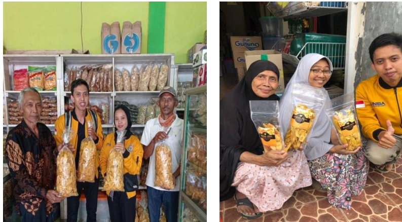
Gambar 6 Pemasaran Banana Chip