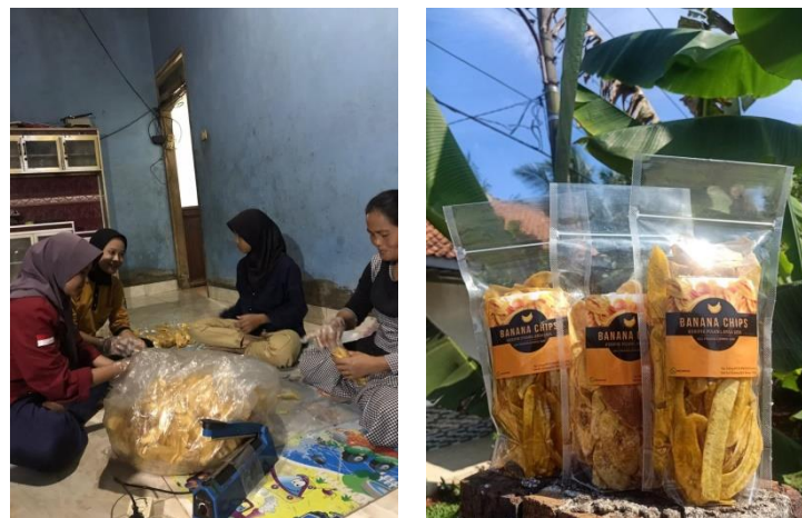
Gambar 4 Proses Pengemasan

Berikut ini adalah bagan produk pengolahan kripik pisang dimana ini adalah acuan kami dalam melakukan penelitian :