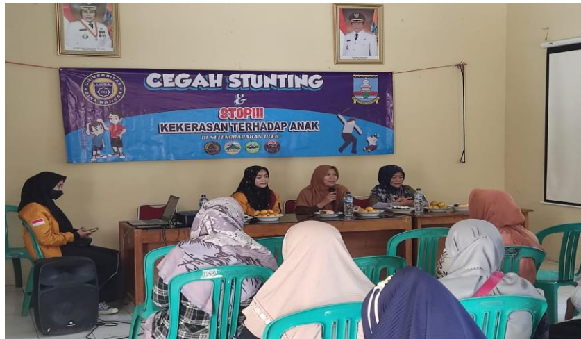
Gambar 5 Kegiatan Edukasi dan Hukum Dalam Sosialisasi Pencegahan Kekerasan terhadap Anak

Berdasarkan berbagai variabel yang disorot dalam kegiatan pendidikan dan hukum dalam sosialisasi penghentian kekerasan terhadap anak, penting untuk dipahami bahwa tindakan kekerasan terhadap anak berdampak signifikan terhadap perkembangan mereka, baik secara psikologis maupun fisik. Akibatnya, sangat penting untuk mengakhiri kebrutalan ini. Orang tua diharapkan dapat mendidik anak-anaknya tanpa menggunakan kekerasan jika mereka memiliki derajat yang lebih tinggi dan pemahaman yang memadai.