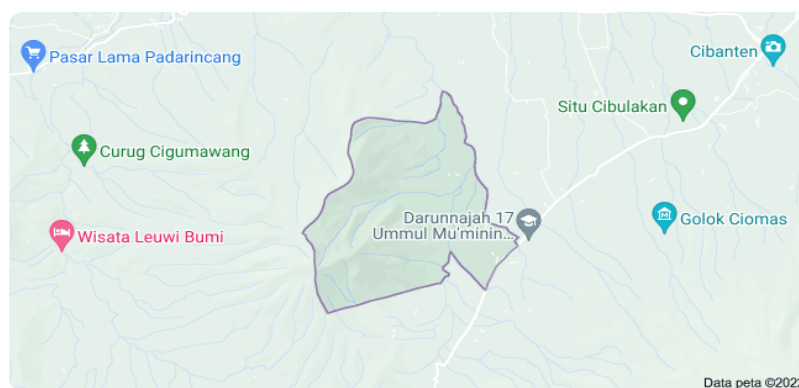
Siketug Kec. Ciomas, Kabupaten Serang, Banten