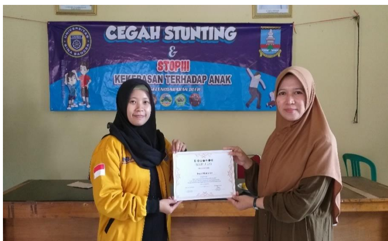
Gambar 4 Penyerahan Sertifikat dalam Kegiatan Sosialisasi

secara bertahap; pertama, pengurusan izin sampai pelaksanaan di Kecamatan Ciomas; kedua, pihak kecamatan memberikan izin kepada mahasiswa untuk kegiatan yang direncanakan; ketiga mengundang perwakilan masyarakat ciomas terutama desa siketug karena desa binaan kelompok mahasiswa; keempat mengundang narasumber yang berkompeten tentang edukasi anak dan tentang penjelasan hukum dalam kekerasan anak. Kegiatan tersebut berjalan dengan lancar berkat bantuan dari berbagai kelompok mahasiswa kerja mahasiswa yang di tempatkan di daerah Ciomas dan perwakilan warga Desa ciomas yang telah diundang secara online dan offline . Kegiatan Edukasi dan hukum dalam sosialisasi pencegahan kekerasan terhadap anak dilakukan secara offline di kantor Kecamatan Ciomas yang dilaksanakan oleh seluruh mahasiswa kuliah kerja mahasiswa yang ada di ciomas dan dosen dengan mematuhi protokol kesehatan saat memasuki ruangan. Materi penyuluhan diberikan oleh Sekmat Ciomas, dosen dan dimoderatori oleh seorang perwakilan mahasiswa yang sedang melakukan pengabdian masyarakat di daerah Ciomas. Acara dilakukan pada hari Minggu, 07 Agustus 2022 mulai pukul 10.00 - 12.00 WIB (Gambar 4).