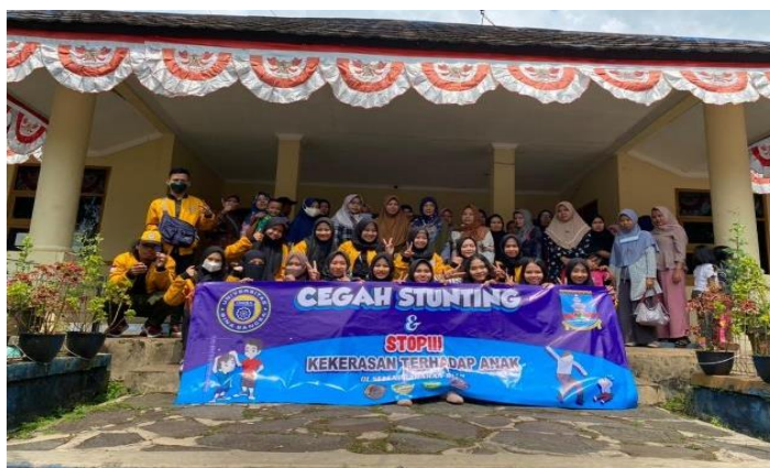
Gambar 3 Perwakilan Seluruh Mahasiswa yang di Ciomas dalam Kegiatan Edukasi dan hukum: sosialisasi pencegahan kekerasan terhadap anak

Metode yang digunakan pada kegiatan pengabdian ini adalah sosialisasi edukasi dan hukum. Metode pelaksanaan secara offline dengan tetap menjaga protokol kesehatan. Untuk pelaksanaan program yaitu tentang pencegahan kekerasan terhadap anak, dilaksanakan pada bulan 7 Agustus 2022 di kantor kecamatan Ciomas kabupaten Serang (Gambar 3) dilaksanakan oleh seluruh kuliah kerja mahasiswa dan dosen yang ditempatkan di kecamatan ciruas.